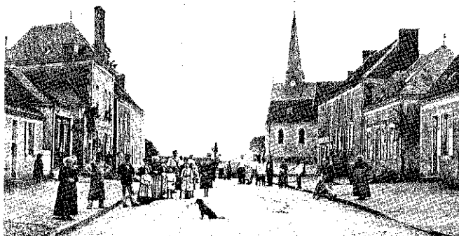
St-RÉMY-DES-MONTS - Le Cloître

Les réponses de la municipalité à l'enquête (8) montrent que la commune compte 1246 arpents de terres labourables « ancienne mesure » soit 635,5 ha, 225 arpents (114,7 ha) de prés et de pâtures, 31 arpents (15,8 ha) de bois taillis et 2 arpents (1 ha) de vieille futaie. La commune posséderait 90 charrues dont 15 tirées par des chevaux seuls et 75 par un attelage de bœufs et de chevaux. Mais ce chiffre est-il approximatif ou obtenu par un comptage précis ? Compte tenu de l'assolement triennal et de la jachère qui règne chaque année sur le tiers des terres soit 415 arpents ce sont 423 hectares qu'il faut labourer, soit une charrue pour 4,7 ha ce qui n'est pas si mal. La première moitié de ces terres reçoit du blé, du seigle ou du méteil (mélange des deux grains), la seconde des céréales de printemps (orge, avoine, menus grains) ou des légumes de plein champ. « Les jardins (sont)