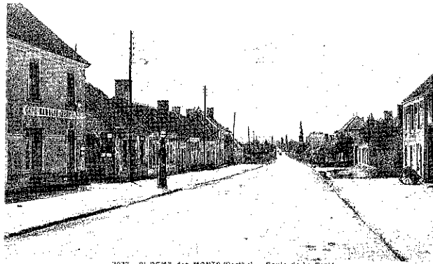
7075. ST-RÉMY-des-MONTS (Sarthe) -- Route de La Ferrière